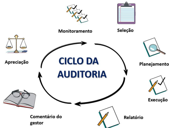
Figura 1: adaptada do TCE-PR