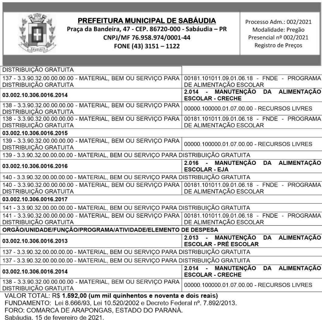
MOISES SOARES RIBEIRO. -Prefeito Municipal-

ANO X – Nº 1636 – PÁG. 14 – SEGUNDA- FEIRA – 16 - 02 – 2021 – EDIÇÃO EXTRAORDINÁRIA